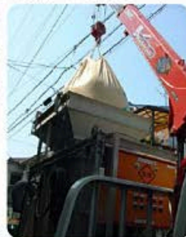
従来型の粉塵防止用シートによる養生